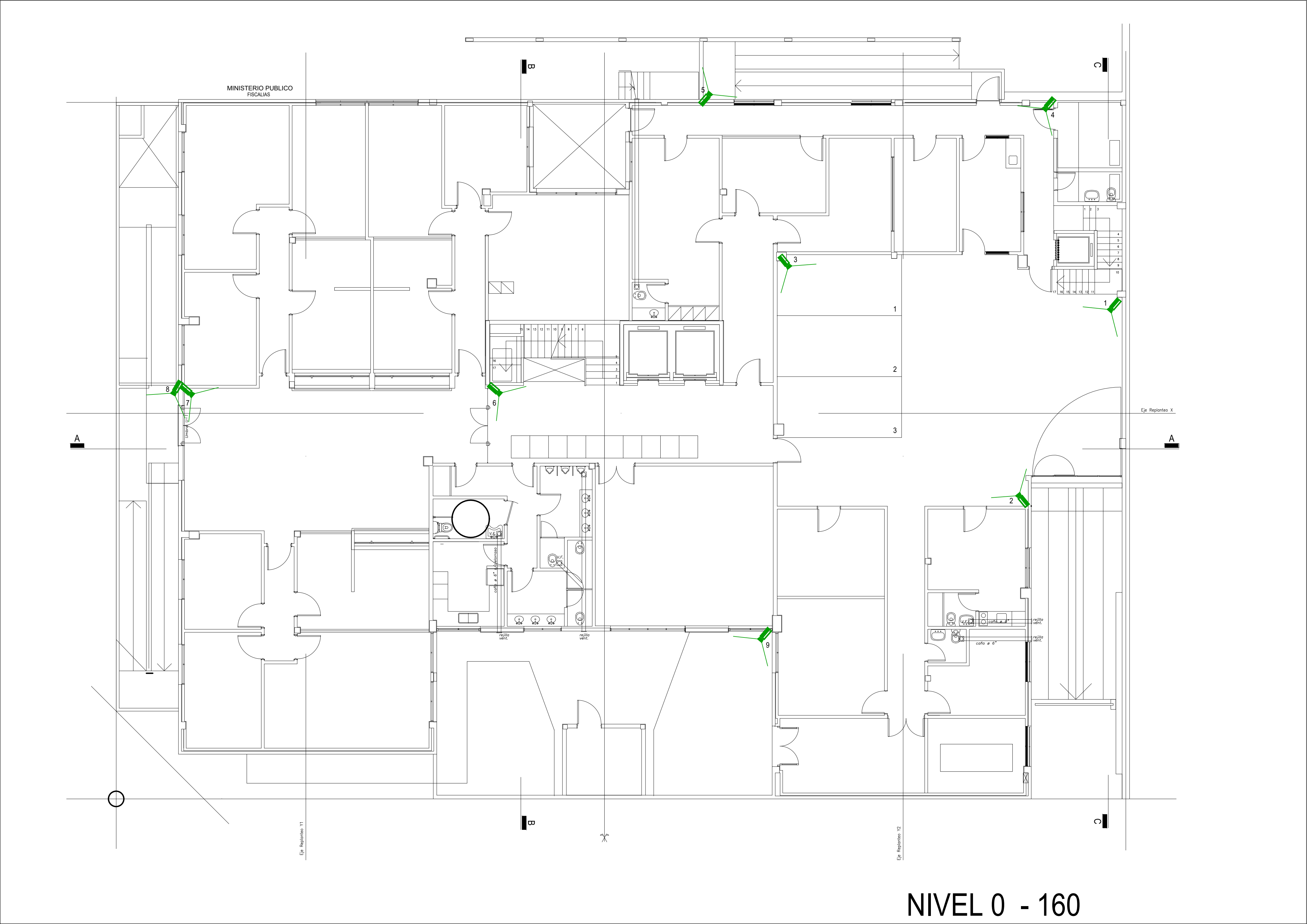
NIVEL 0 - 160

PLANO PARA COTIZAR PARA EJECUTAR VERIFICAR MEDIDAS EN OBRA